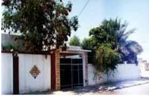
حسينية الرسول الأعظم - قسم النساء