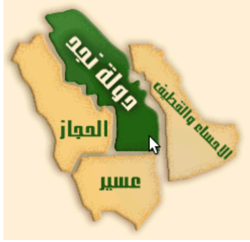
خارطة تنشر على مواقع شيعية

وهذا مما يدل على التقارب الحقيقي بين كافة أبناء اليهودية العالمية (ابن سبأ، الشيعة، الشيعوية، ماركس)! كما أن الشيعة المعارضين للنظام السعودي لهم عشرات المواقع على شبكة الإنترنت تهاجم المملكة، بل إن بعضها يطالب بتقسيم السعودية إلى عدة دول؛ كموقع «دولة الإحساء»، وموقع «دولة الحجاز»، وموقع «دولة عسير»!