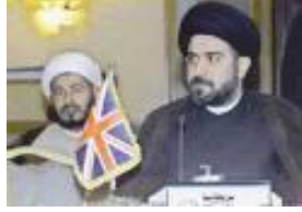
عبد المجيد الخوئي في ندوة في لندن

أسسه عبد المجيد الخوئي، نجل المرجع أبي القاسم الخوئي سنة (٢٠٠٣م) في لندن، وهو ذو طابع اجتماعي ثقافي؛ غير سياسي. الخوئي يرفض فكرة (ولاية الفقيه)، وينتقد الحكومة الدينية في إيران. تعثر المجلس بمقتل الخوئي في النجف؛ من قبل أتباع مقتدى الصدر (١) ، في شهر (أبريل/ نيسان ٢٠٠٣)، قبيل سقوط بغداد. يشرف المجلس على مؤسسة «الخوئي الخيرية» في لندن، و«مجلة النور».