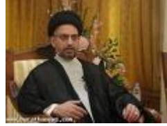
عبد العزيز الحكيم