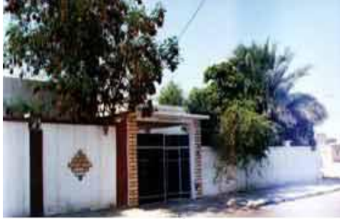
حسينية الرسول الأعظم - قسم النساء