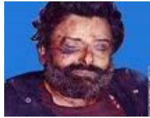
جثة حسين الحوثي

يعتبر التمرد الذي قاده الحوثيون بدءاً من يونيو/ حزيران سنة ٢٠٠٤م أحد مظاهر الاختراق الإثني عشري للزيدية في اليمن. ففي ذلك العام: قاد حسين بدر الدين الحوثي تمرداً ضد السلطات، في منطقة صعدة بشمال اليمن، واستمر لمدة (٣) أشهر، قتل فيه أكثر من (٤٠٠) شخص، وقتل فيه حسين الحوثي.