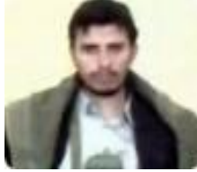
عبد الملك الحوثي

وما زال القتال يندلع بين الحين والآخر مسبباً الكثير من الخسائر في الأرواح والممتلكات.