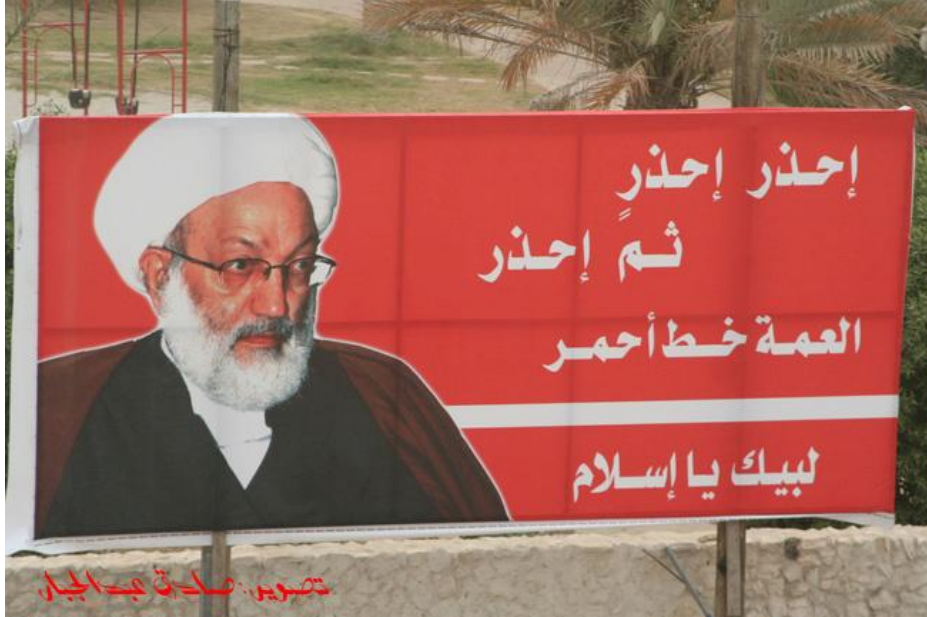
الشيخ عيسى أحمد قاسم