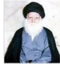
محمد صادق الصدر

وهو تيار كبير، وشبابي؛ يفتقد للتجانس، وللمراجع، والمرشدين، ويتركز في مدينة الثورة (مدينة الصدر حالياً).