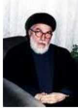
محمد بحر العلوم

وهو والد إبراهيم بحر العلوم؛ وزير النفط في العراق (٢٠٠٣-٢٠٠٥).