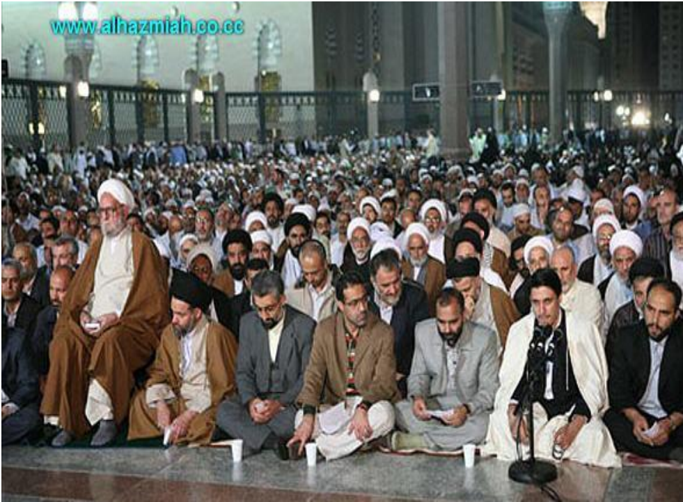
تجمع للشيعة الإيرانيي في ساحة الحرم النبوي - قرب البقيع

وفي عام (١٤١٣ هـ) قاموا بثورة أخرى عند الثانوية الصناعية في المدينة، وتصدى لهم هذه المرة المواطنون من أهل السنة؛ فقمعهم بالقوة حتى تدخلت قوات الأمن لفض الاشتباكات، وحصل فيها إصابات وفوضى كبيرة. كما أنهم دعوا إلى تدويل مقبرة البقيع، ومن ثم وسعوا هذا إلى المطالبة بتدويل الإشراف على الحرمين الشريفين، وهذا يناقض بشكل صارخ احترامهم لبلدهم، ويطعن في وطنيتهم بشكل لا لبس فيه! وذلك جرياً على قاعدة: «ما لي فهو لي، وما لك فهو مشترك بيننا»!!