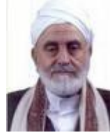
إبراهيم بن محمد الوزير

وبالرغم من الانتشار المحدود لهذه الصحف، وقلة قرائها؛ إلا أنها تلعب دورًا في الترويج لعقائد الشيعة، ومهاجمة هيئات علماء أهل السنة؛ على اختلاف تياراتهم؛ كالشيخ عبد المجيد الزنداني، والشيخ عبد الوهاب الديلمي، والشيخ حسين بن شعيب، والوقوف في صف العلمانيين، والرّد على ما يكتب في صحف ومجلات التيارات السنية؛ كالسلفية، وجماعة الإخوان المسلمين.