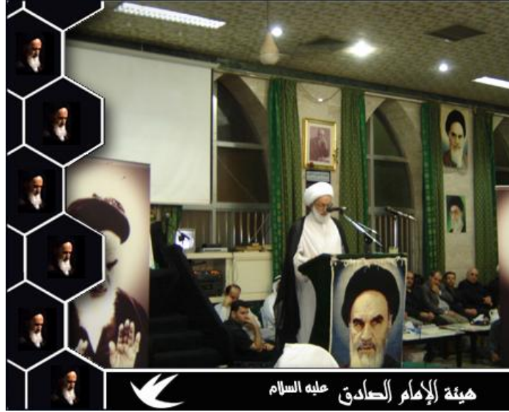
زعيم شيعة البحرين تحيط به صور الخميني في أحد خطابه

٢- أن التجمعات الشيعية في العالم، وفي دول الخليج - خاصة - تتأثر سلبيًا وإيجابيًا بعلاقات بلدانهم مع إيران، خاصة وأن غالب هذه الجاليات تستخدم من قبل إيران لتنفيذ مخططاتها في هذا البلد أو ذاك. ولقد كانت العلاقات الإيرانية البحرينية مثالاً للتوتر والشكوك في معظم فتراتهما، بسبب أطماع إيران في هذه الجزيرة، واعتبارها جزءاً من أراضيها، وعدم الاعتراف بجوازات السفر التي كانت تصدرها البحرين، واعتبارها محافظة إيرانية، بل واحتسابها من إرث مملكة فارس؛ التي ورثتها إيران اليوم. ولا يقتصر النهج العدائي هذا على جزيرة البحرين، بل قامت إيران باحتلال ثلاث جزر تتبع دولة الإمارات العربية المتحدة هي: (طنب الكبرى، وطنب الصغرى، وأبو موسى) سنة ١٩٧١، وسنة ١٩٩٢، وما زالت إيران تحتلها حتى اليوم، وترفض التخلي عنها، وتوعد وجودها فيها.