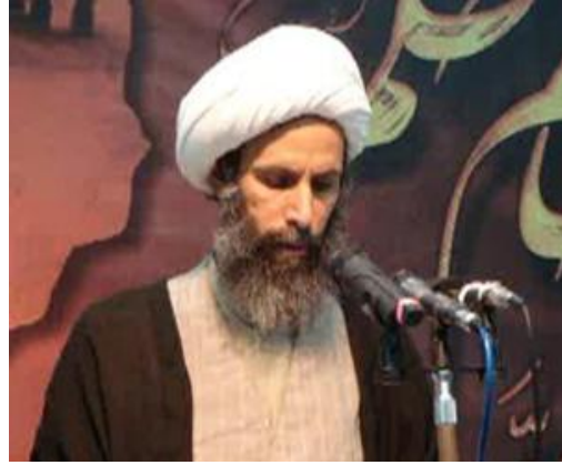
نمر باقر النمر