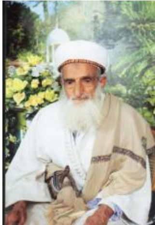
حمود بن عباس المؤيد

F مركز ومسجد النهرين: الذي يقع في منطقة صنعاء القديمة، ويستمد أهميته من شخصية إمام المسجد حمود بن عباس المؤيد؛ مفتي الجمهورية، وهو رجل كبير السن يستغل الشيعة اسمه في دعوتهم؛ بسبب قبول الناس له.