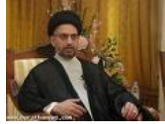
عبد العزيز الحكيم