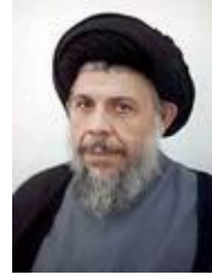
محمد باقر الصدر

وقد كان حزب الدعوة - في بداياته - يضم بعض اللبنانيين مثل: السيد محمد حسين فضل الله، ومهدي شمس الدين؛ الذين نقلوا تجربة الحزب للبنان (٢) ، وقد كان محمد باقر الصدر هو المرجع للحزب؛ حتى بعد خروجه منه، وقد تعرض الحزب في مسيرته إلى عدد من الانشقاقات (٣) .