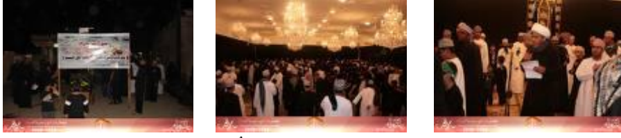
من طقوس عاشوراء في عُمان