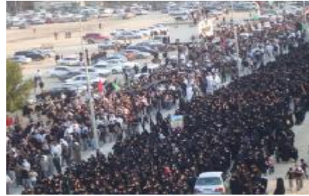
صور لأحداث الشعب الشيعية في البحرين