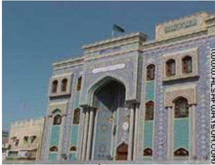
مآتم الكراشية في دبي

ويعتبر «مآتم العدواني»، و«مآتم الكراشية» من أشهر المآتم الموجودة في دبي.