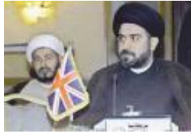
عبد المجيد الخوئي في ندوة في لندن

أسسه عبد المجيد الخوئي، نجل المرجع أبي القاسم الخوئي سنة (٢٠٠٣م) في لندن، وهو ذو طابع اجتماعي ثقافي؛ غير سياسي. الخوئي يرفض فكرة (ولاية الفقيه)، وينتقد الحكومة الدينية في إيران. تعثر المجلس بمقتل الخوئي في النجف؛ من قبل أتباع مقتدى الصدر (١) ، في شهر (أبريل/ نيسان ٢٠٠٣)، قبيل سقوط بغداد. يشرف المجلس على مؤسسة «الخوئي الخيرية» في لندن، و«مجلة النور».