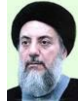
محمد باقر الحكيم