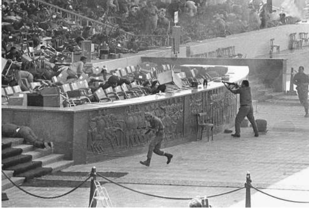
لحظة اغتيال الرئيس المصري محمد انور السادات على منصة الاستعراض العسكري يوم 6 أكتوبر 1981