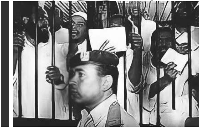
محاكمة عناصر جماعة الجهاد