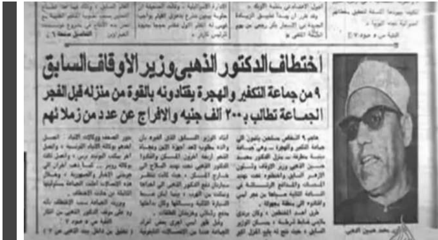
محمد حسين الذهبي (19 أكتوبر 1915 - 1977) وزير الأوقاف المصري الأسبق.

وللأسف لا تزال جهالات هذا الفكر حية بصورة مطورة ولا تزال سياسات شكري الخاطئة تتكرر عند كثير من جماعات العنف والتكفير المعاصرة، ولا يزال كثير من الشباب المتحمس يندفع للتورط في فكر الغلو والتكفير وسلوك الإرهاب والإجرام، وهو يظن أنه يجاهد في سبيل الله!