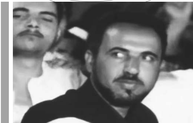
صالح عبد الله سرية (1936م - 1976م)