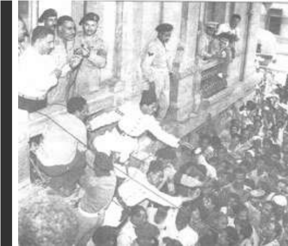
حادثة إطلاق النار على رئيس مجلس الوزراء آنذاك جمال عبد الناصر، في 26 أكتوبر 1954 أثناء إلقاء خطاب في ميدان المنشية بالإسكندرية بمصر.

استمر التنظيم في العمل على كسب أعضاء جدد، ولا تتوفر في المصادر والمراجع معلومات إضافية عن دور نبيل برعي بعد تأسيس الخلية الأولى، حيث اختفى ذكره (٣) ،