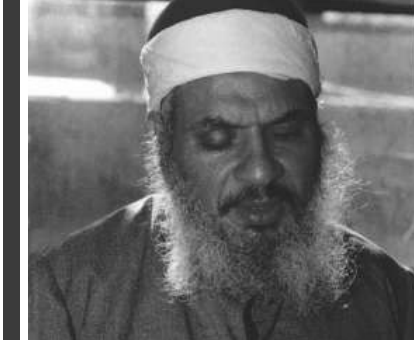
الشيخ عمر عبد الرحمن

يبدو أن الجماعة في السجن خططت للمستقبل من خلال توجيه الأفراد الذين تم الإفراج عنهم على دفعات على النحو التالي: من حُكم عليه بالسجن بثلاث سنوات وخرج في سنة ١٩٨٤ كُلف بنشر فكر الجماعة الذي كُتب في السجن، والأفراد الذين حُكم عليهم بخمس سنوات كُلفوا ببناء هيكل تنظيمي للجماعة، والأفراد الذين