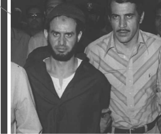
شكري أحمد مصطفى (1942م - 1978م)