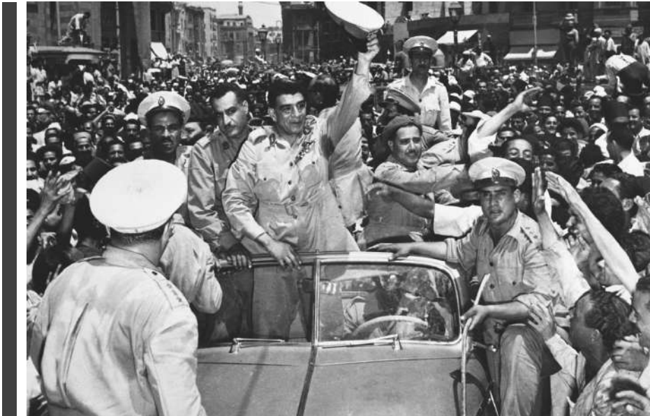
الرئيس المصري محمد نجيب والضباط الأحرار أثناء الاحتفال بثورة 23 يوليو 1952 وسط ترحيب شعبي

وكان الشعب المصري ينتظر من حكومة الثورة مراعاة مصالحه وهويته ولكن سرعان ما ظهرت الأجندة الخفية لجمال عبد الناصر وحدث الصدام مع قطاعات واسعة من الشعب المصري.