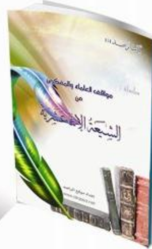
مواقف العلماء والمفكرين من الشيعة الاثنا عشرية