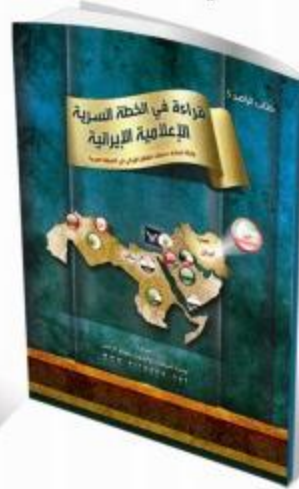
قراءة في الخطة السرية الإعلامية الإيرانية