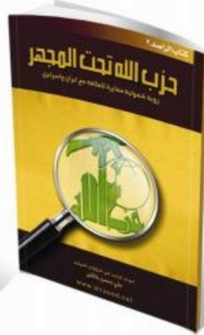
حزب الله تحت المجهر رؤية شمولية مقابرة للعلاقة مع إيران وأسرائيل علي حسن باكير